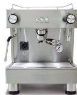
Bar Pod 1GR (40cm)