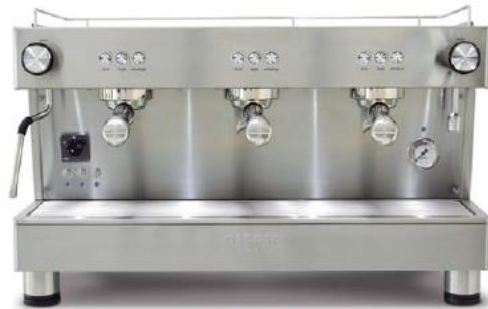
Bar Versatile 3GR (70cm)