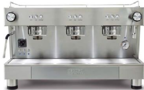
Bar Capsule Auto-ejection 3GR (70cm)