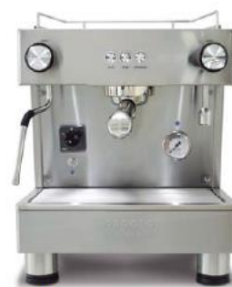
Bar Versatile 1GR (40cm)