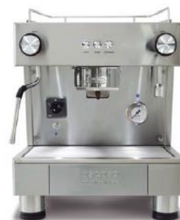
Bar Capsule Auto-ejection 1GR (40cm)

Drawer for disposable capsules. 50 u. Alarm sounds when full. Cajón cápsulas desechables. 50 u. Avisador acústico.