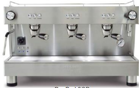
Bar Pod 3GR (70cm)