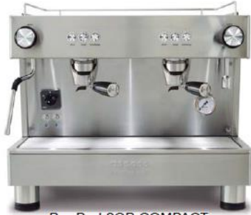
Bar Pod 2GR COMPACT (56cm)