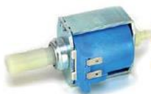
ARS coffee pump Bomba ARS café 65W-20bar