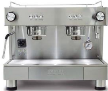
Bar Capsule Auto-ejection 2GR COMPACT (56cm)