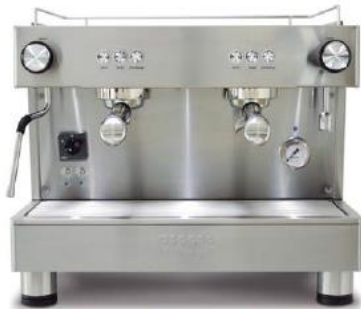
Bar Versatile 2GR COMPACT (56cm)