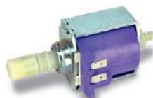
ARS steam pump Bomba ARS vapor 35W-0,6L/min

Silent. Self-priming. Professionals. Silenciosas. Auto cebantes. Profesionales.